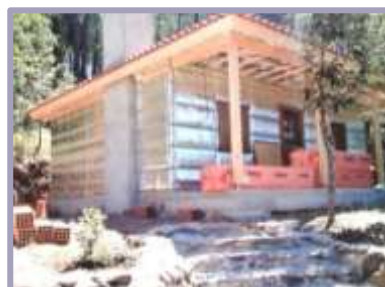
Casa de Madera