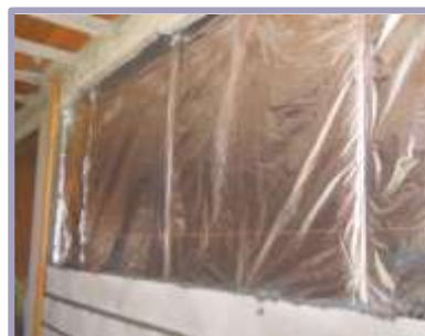
Solución Térmica Pared